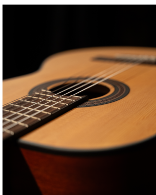
Tavola in abete, fondo e fasce in mogano, ponte e tastiera in palissandro. La scelta dei legni e dei materiali è stata orientata all'estetica e alla qualità timbrica.

L'attento set up delle ESTUDIO è votato alla suonabilità, caratteristica imprescindibile per affrontare la pratica con serenità e comfort. Potrai in ogni caso regolare la tensione del manico agendo sul truss rod a due vie, trovando il set up che più si addice al tuo modo di suonare.